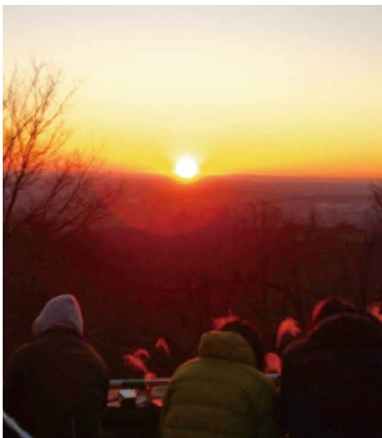
防寒・安全対策は万全に

冬季の登山道は凍結により滑りやすだけでなく、山頂では寒さによる低体温症で救急搬送されるケースも発生しています。十分な防寒対策とトレッキングシューズの着用、ヘッドライトの準備など、安全対策を行ってください。お越しの際は公共交通機関のご利用を。