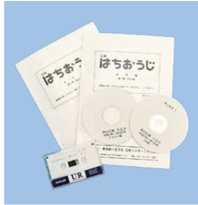
視覚に障害がある方へ