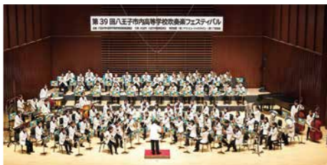
迫力の演奏を楽しんで